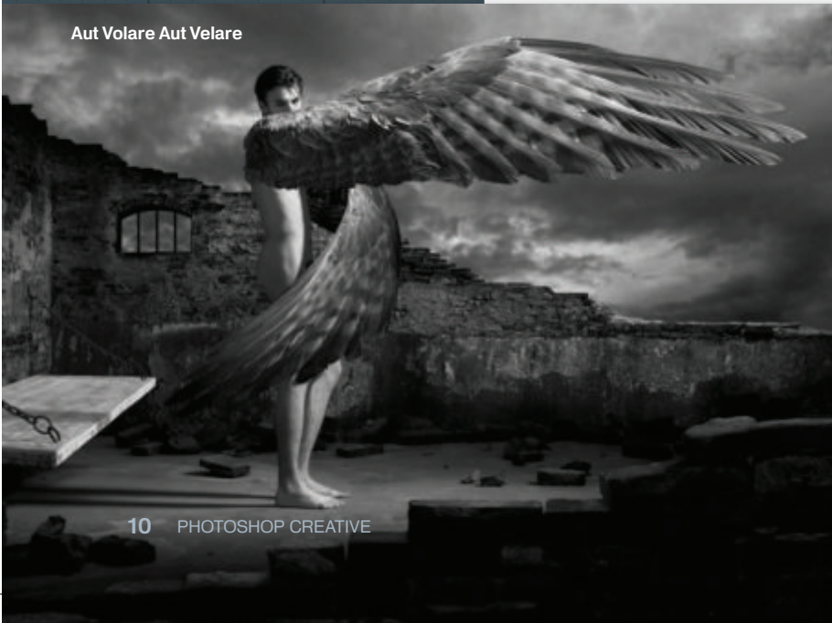
Aut Volare Aut Velare